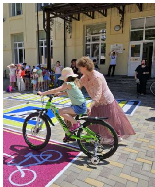
«Беседа о ПДД, БДД»