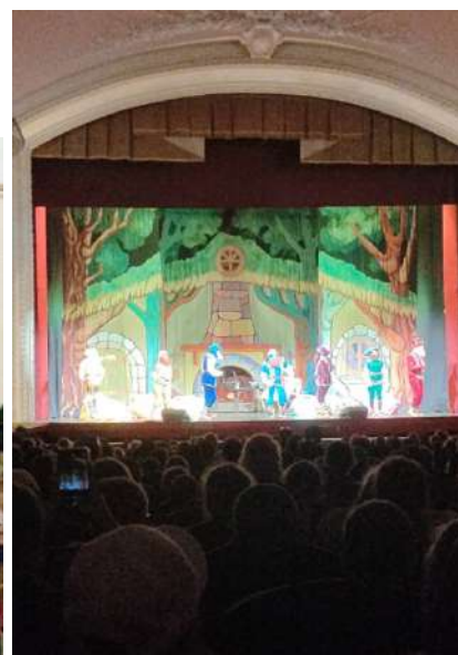
Посещение Ставропольского государственного краевого театра оперетты

После чего ребята сходили на экскурсию к еще одной музыкальной достопримечательности города - Лермонтовской галерее. Там вожатые рассказали об истории памятника культуры.