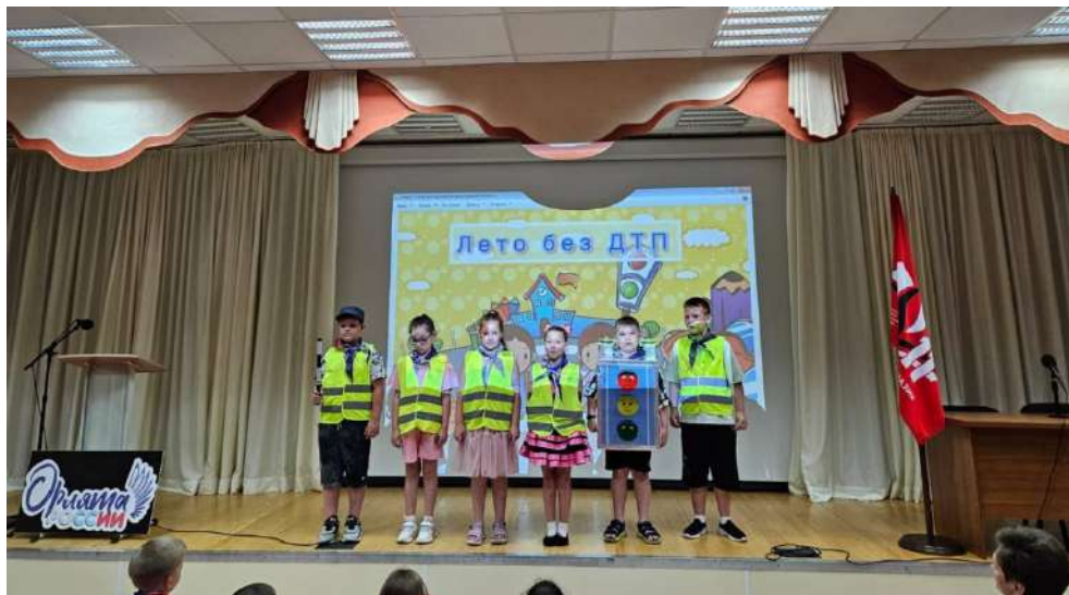
Выступление отряда ЮИД

Нельзя забывать и о БДД, ПДД, безопасности дома и в общественных местах. С отрядом ЮИД ребята вспомнили правила, необходимые для сохранения жизни и здоровья.