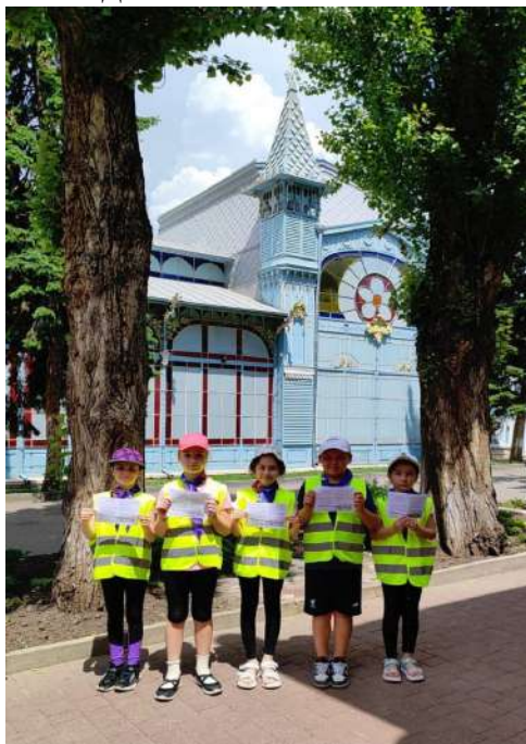
Акция «Мы за безопасность!»

После этого орлята участвовали в социальной акции по пропаганде безопасности дорожного движения «Мы - за безопасность!», направленной на популяризацию деятельности детских отрядов юных инспекторов движения, профилактику детского дорожно-транспортного травматизма и соблюдение правил дорожного движения.