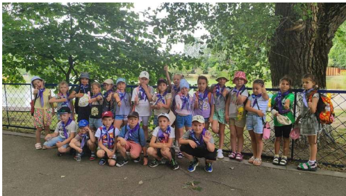
«Орленок - лидер»

После завтрака дети отправились на прогулку в парк им. Кирова. Там они играли по станциям в подвижные командные и индивидуальные игры «Мы-орлята!»