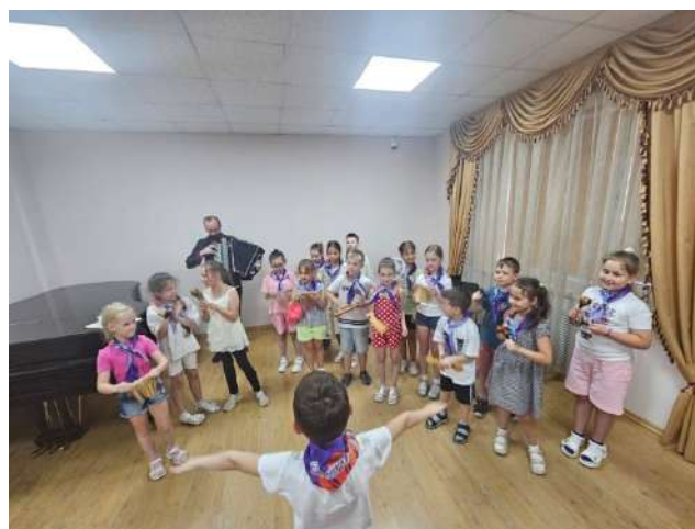
Посещение концертного зала Камертон