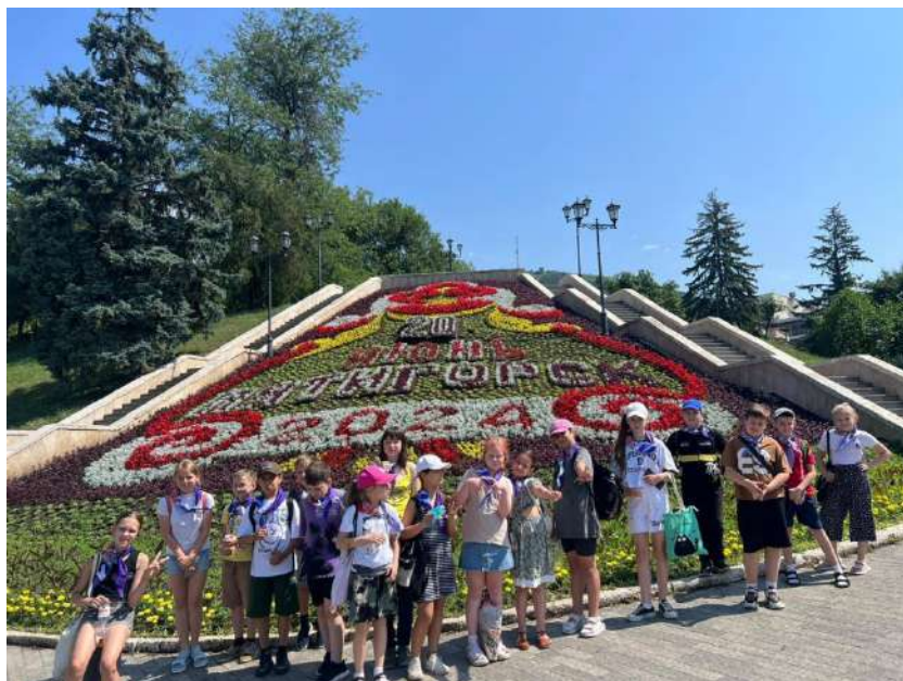
«Орленок - краевед»

Тринадцатый день в лагере с тематической сменой «Орлята России» был наполнен экскурсиями, викторинами и беседами, чувством патриотизма, любви к Пятигорску, гордостью к историческому прошлому малой родины. Ведь сегодняшний модуль «Орленок-краевед».