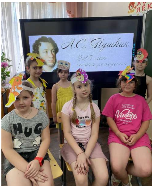
«А.С.Пушкин- наше все!»

Четвертый день в пришкольном лагере „Машук,, был посвящен модулю „Орленок-эрудит,, и 225-летию со дня рождения А.С.Пушкина.