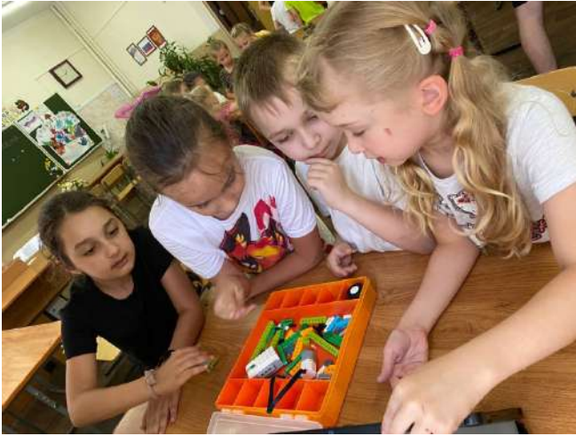
Мастер- класс по робототехнике

После обеда наши орлята смогли проявить свое мастерство и умения в конструировании, посетив мастер-класс по робототехнике.