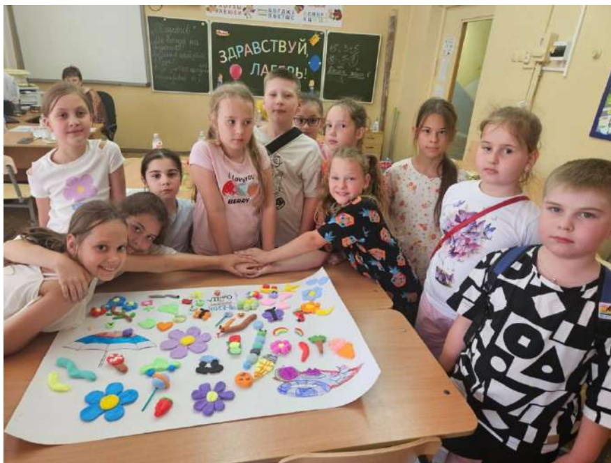
Краткосрочный проект «Лето - это маленькая жизнь»

После обеда вожатые в отрядах организовали творческое занятие - краткосрочный проект. Каждый ребенок вылепил из воздушного пластилина «частичку лета», а затем все «пазлы» сложили в единое панно своего отряда – «Лето-это маленькая жизнь». Старания были отмечены вожатыми и все участники проектов получили сладкие подарки.