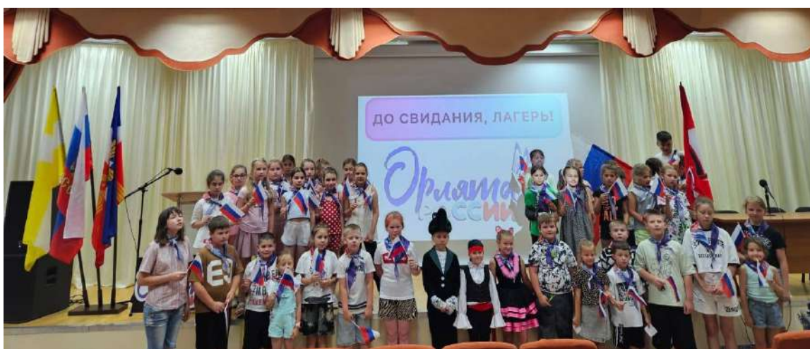
«Орленок - артист»

Сегодня состоялось закрытие смены пришкольного лагеря с тематикой «Орлята России». Утро началось с бодрой зарядки «Я страны достойный житель». Перед завтраком дети вспомнили все лучшее, что произошло с ними в период смены. В течение трех недель ребята были вовлечены в калейдоскоп событий, где каждый следующий день отличался от предыдущего. В соответствии с запланированными модулями, воспитанники нашего лагеря были посвящены в «Орлята России» и ежедневно проживали новые роли, участвовали в тематических мероприятиях. Орлята были эрудитами, краеведами, хранителями, музыкантами, художниками, туристами, патриотами, мастерами, лидерами, спортсменами, эколятами и др.