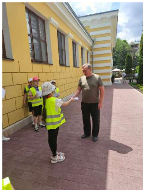
Отряд ЮИД раздает листовки с правилами БДД прохожим